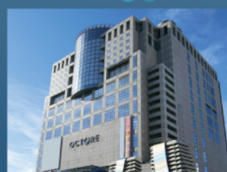
八王子市 学園都市センター