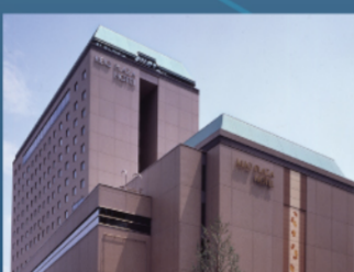
京王プラザホテル 八王子