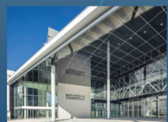
東京たま未来メッセ (東京都立多摩産業交流センター)