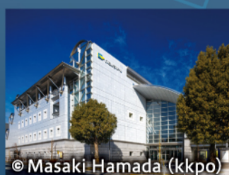
いちようホール (八王子市芸術文化会館)