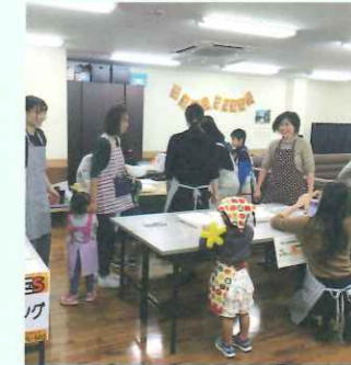
キッズクッキング