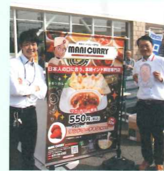
カレー屋さん出店